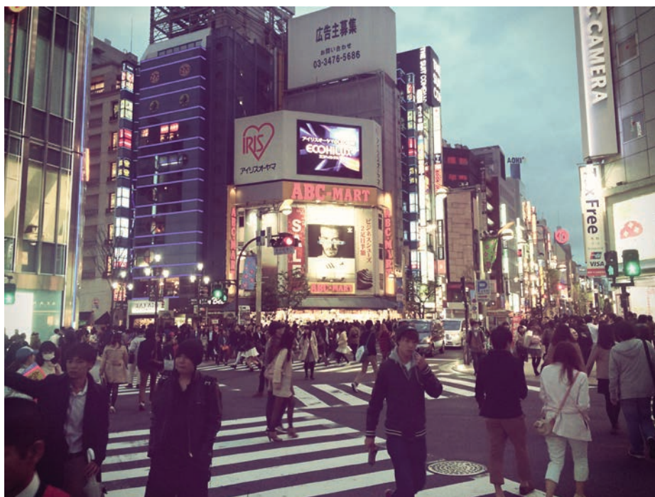
Japón tiene la tasa de homicidios más baja del mundo.

Específicamente, UNODC divide a las Américas en cuatro subregiones: Norteamérica, Centroamérica, Sudamérica y el Caribe (ver cuadro 2 en el anexo). Las diferencias entre estas subregiones son profundas. Mientras la violencia homicida se ha reducido en Norteamérica y Sudamérica, en Centroamérica y el Caribe ha alcanzado niveles epidémicos. Hoy el promedio subregional en Centro América es aproximadamente 29 homicidios por cien mil habitantes, y sobre 17 en el Caribe. Centroamérica es la región del mundo con la tasa promedio de homicidios más elevada del planeta.