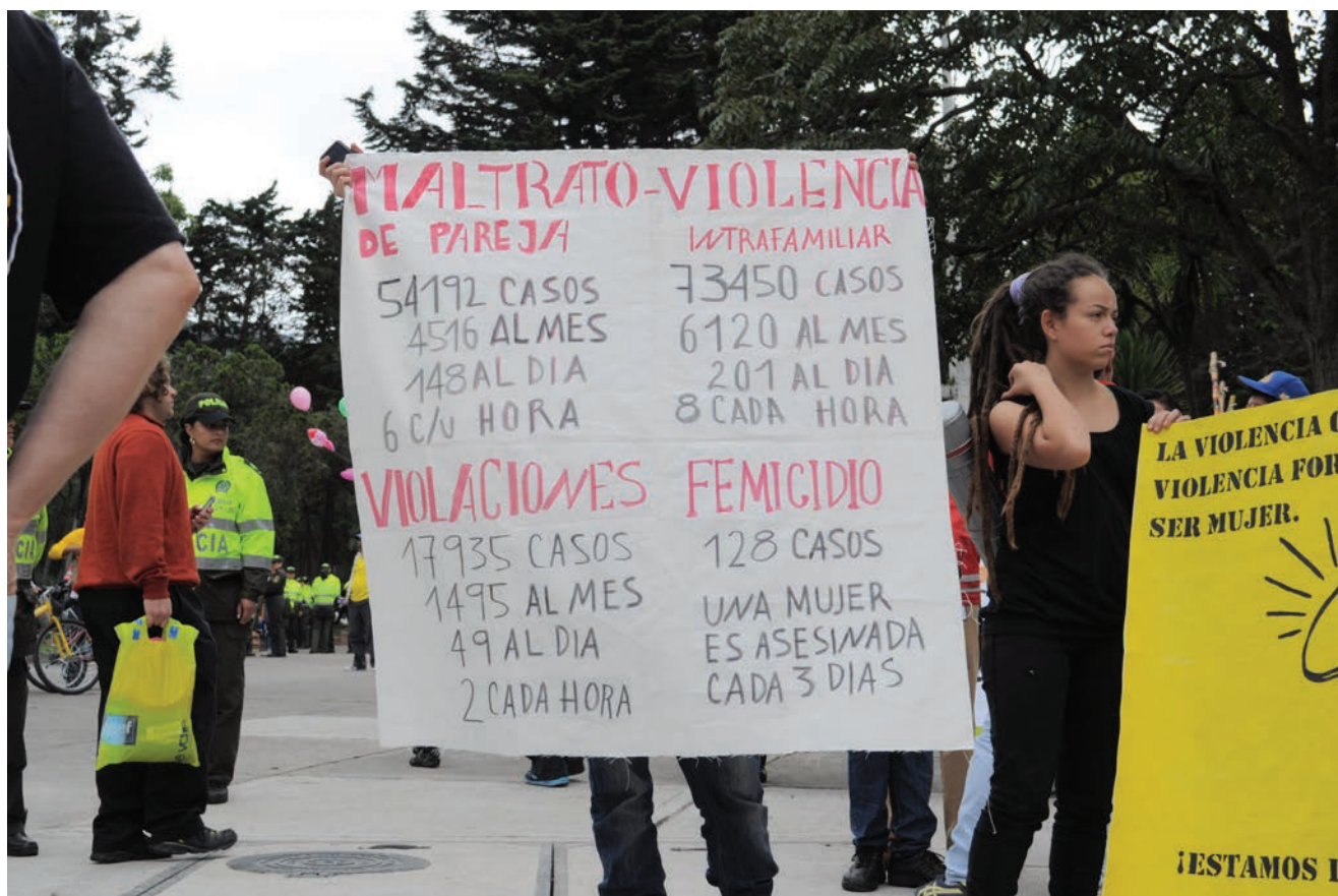
Delegacia de la Mujer en Campinas, São Paulo, Brasil.

En este contexto, el sector de seguridad y justicia asume un carácter primordialmente contrainsurgente, concentrándose más en la seguridad nacional y menos en los factores estructurales que afectan la seguridad de las mujeres y su día a día. Por lo tanto, es en el marco del conflicto que tanto el gobierno como la sociedad colombiana desarrollan sus demandas y acciones en el ámbito del estado de derecho, incluso en lo que refiere a la garantía de los derechos de las mujeres. Sin embargo, el uso de violencia sexual en el marco del conflicto profundiza las diversas formas de violencia contra la mujer, creando una compleja amalgama en la que coexisten distintas violencias, lo que dificulta la formulación de políticas y estrategias específicas.