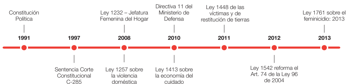
Figura 2: Línea del tiempo de los principales marcos legales internacionales y de la legislación colombiana

los agresores y de diligencia para las autoridades en casos de feminicidio. 48 Del otro, la ley ofrece un componente normativo educativo con un carácter pedagógico, que inclusive involucra al Ministerio de Educación. De esta forma, se prevé un enfoque de género en procesos educativos, también con el objetivo de prevenir estos tipos de violencia. La ley también destaca la importancia de un sistema nacional de estadísticas sobre la violencia basada en género que permita analizar sistemáticamente este fenómeno.