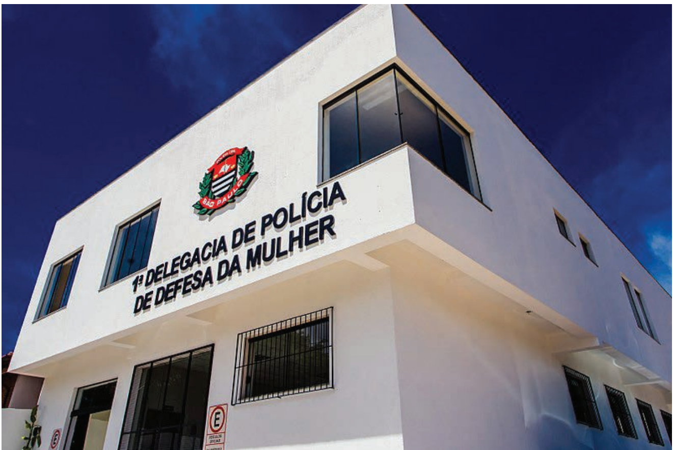
Delegacia de la Mujer en Campinas, São Paulo, Brasil.

Desde 1986, se instauraron otras 14 DEAM, a las que se sumaron 19 Núcleos de Atención a la Mujer (NUAM). Los NUAM surgieron a partir de la demanda por una atención con profesionales capacitados y un ambiente diferencial de la Policía Civil en localidades que no contaban con una DEAM. Estos núcleos funcionan 24 horas al día, en un espacio reservado dentro de las comisarías distritales, y cuentan con un equipo formado por policías capacitados, preferentemente mujeres, para atender a las mujeres víctimas de violencia doméstica y abuso sexual. Funcionan en 19 comisarías distritales ubicadas en las regiones que registran una gran incidencia de casos, tanto en el área metropolitana como en el interior del estado.