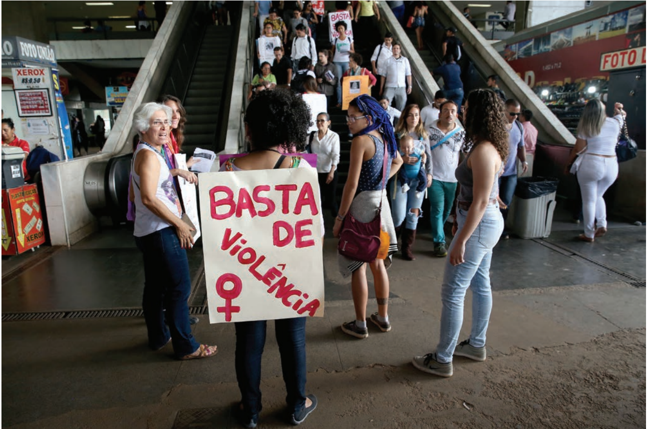
Mujeres en una manifestación contra el feminicidio en el Distrito Federal, Brasil.

como el asesinato de mujeres en razón de su género, es la expresión extrema del patriarcalismo. Se trata de la manifestación máxima de la violencia y es precedida por otros tipos de violencia, desde la moral y psicológica hasta la sexual y física. Por basarse en relaciones desiguales entre los géneros, el feminicidio y las diversas expresiones de la violencia contra las mujeres no pueden ser analizadas de forma separada del contexto social y cultural en que ocurren. 13