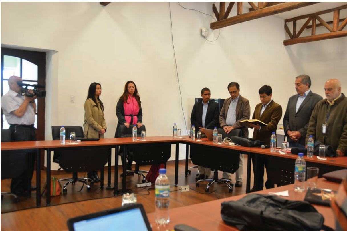
Um dos diálogos de paz entre o governo colombiano e o ELN.

O texto está estruturado da seguinte forma. A primeira parte apresenta um pano de fundo do conflito na Colômbia e resume as principais características e dinâmicas do ELN, diferenciando-o dos demais grupos armados ilegais que surgiram no país, sobretudo as FARC e o M-19. Em seguida, o texto analisa o papel do Brasil na segurança latino-americana, com destaque para o seu histórico na mediação de conflitos através da diplomacia preventiva, e examina a sua relevância como garante nas negociações com o ELN. A terceira e última parte oferece algumas recomendações concretas para que o Brasil amplie suas contribuições para a consolidação da paz na Colômbia e, de forma mais abrangente, para que possa fortalecer sua capacidade de atuação na prevenção e resolução de conflitos armados internacionais.