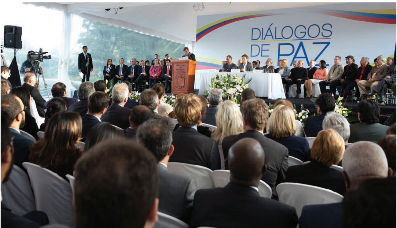
Diálogos de paz entre o ELN e o governo colombiano, 2017.