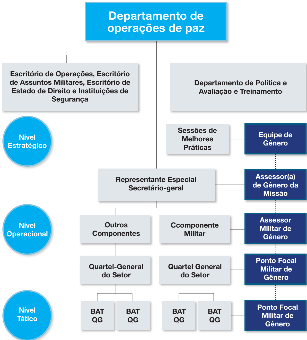
Figura 1. Assessor(a) e Ponto Focal de Gênero: estrutura genérica