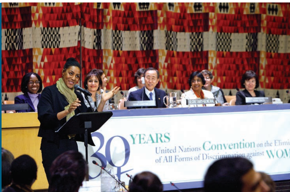
O 30º aniversário da CEDAW foi celebrado em Nova Iorque no dia 3 de dezembro de 2009.