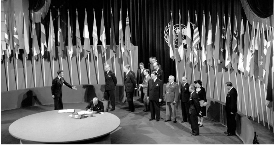
Brasil assina a Carta das Nações Unidas, na Conferência de São Francisco (26/06/1945).