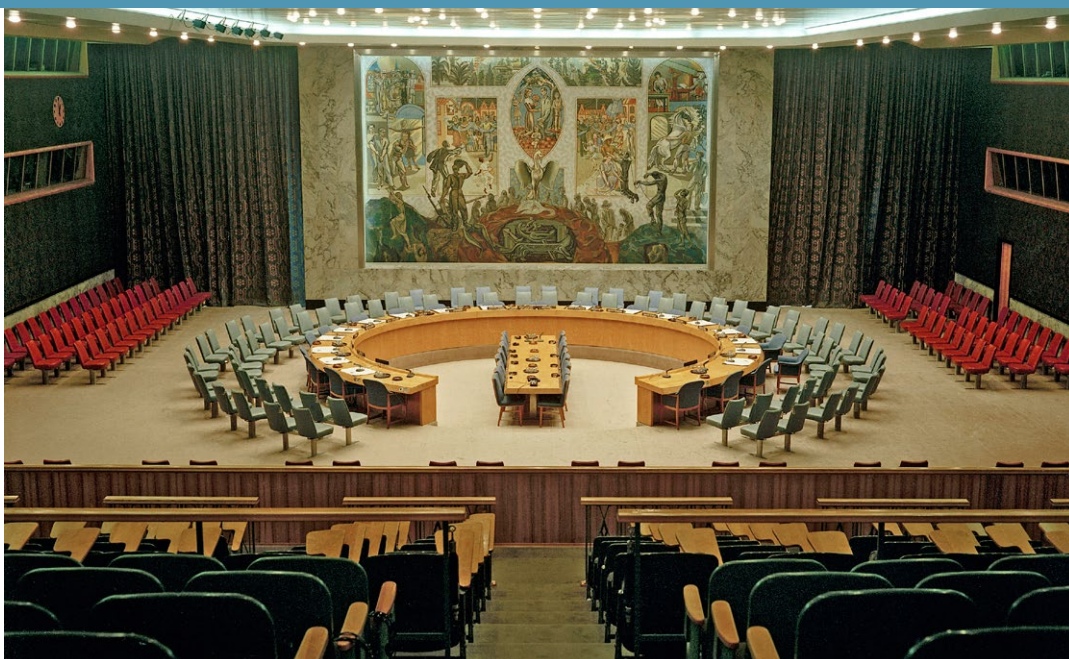
Sala do Conselho de Segurança logo depois do aumento de 11 para 15 membros (01/09/1966).