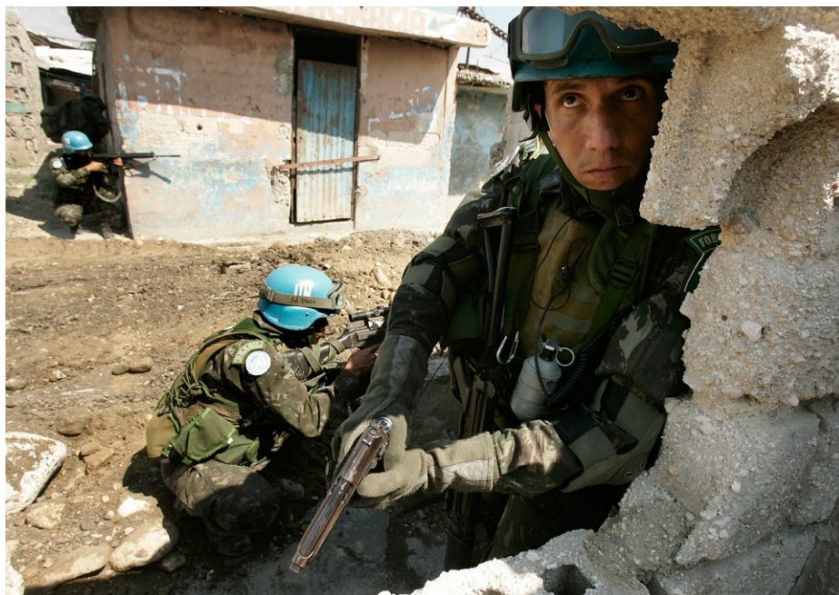
Soldados brasileiros, sob a bandeira da ONU, participam de operação que pacificou Cité Soleil, na capital haitiana (09/02/2007).

relação de causalidade entre determinados atos e os efeitos verificados na prática. No campo da paz e segurança, destacam-se pelo menos dois aspectos que contribuem para a construção de uma imagem bastante positiva do país e, assim, reforçam a capacidade do Brasil de influenciar normas e comportamentos sem recorrer a punições ou incentivos. São eles: (1) a preocupação com a qualidade do serviço militar prestado durante o engajamento com missões de paz da ONU; e (2) a capacidade político-diplomática de manter, ao mesmo tempo, um diálogo aberto e construtivo com o Norte e de desempenhar papéis de liderança compartilhada no Sul Global. Tal situação, não necessariamente articulada pelas sucessivas administrações, acaba por levar ou reforçar uma série de resultados positivos ao país.