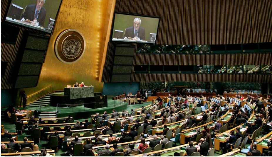
Assembleia Geral elege cinco membros não-permanentes para o Conselho de Segurança, inclusive o Brasil (15/10/2009).

no CSNU (gradual ou radical) mina cada vez mais o próprio arcabouço de paz e segurança internacional.