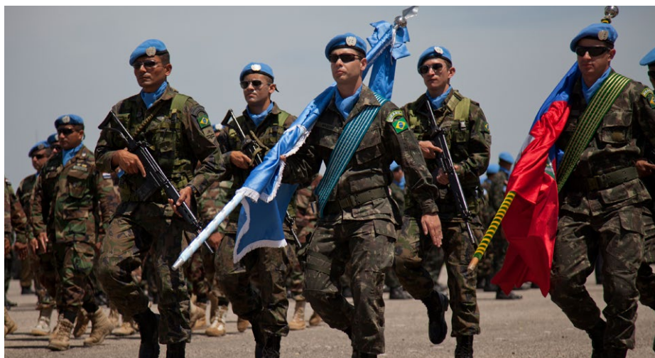
Cerimônia promovida pela MINUSTAH celebra o Dia dos Peacekeepers (29/05/2013)

Em termos militares, o país simplesmente não dispõe dos recursos tradicionais de poder. Pelo volume de suas forças armadas, o Brasil alcança a 28ª posição mundial: são cerca de 300 mil militares das três forças, para uma população de 200 milhões de pessoas. Seus investimentos na área equivalem a 1,5% do PIB,