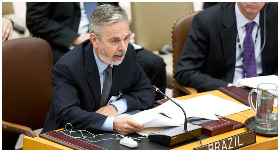
Brasil apresenta sua posição no Conselho de Segurança, em debate sobre proteção de civis em conflitos armados (12/02/2013).

vontade política de cada Estado-membro. Assim, devido ao avanço do produto interno bruto do Brasil, o valor da contribuição brasileira aumentou para o biênio 2014/2015 em cerca de 80%, passando para 0,5868%. Com isso, o país saltou da 28ª para a 21ª posição. Porém, a despeito do avanço em termos de cálculos, desde 2012 o Brasil não remete boa parte de suas contribuições obrigatórias ao Sistema ONU. Hoje, a dívida alcança 87 milhões de dólares norte-americanos somente para o orçamento das missões de paz. Além disso, são 76,8 milhões de dólares de dívida em relação ao orçamento regular da ONU, que cobre também as missões políticas especiais 25 . Tal situação, se persistir, poderá levar à suspensão do direito de voto do Brasil na AGNU, como dispõe o Artigo 19 da Carta 26 .