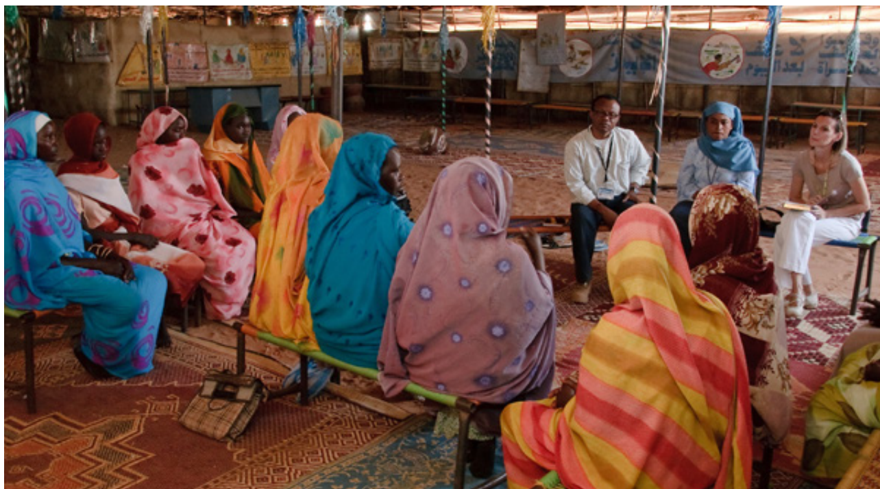
Funcionários da Seção de Assuntos Cívicos da Operação Híbrida da União Africana e das Nações Unidas em Darfur (UNAMID) conversam com mulheres desalojadas internamente sobre sua situação de segurança e de saúde (Darfur, 3 fevereiro de 2009)

A título de exemplificação, os salários são calculados segundo o valor de base para cada categoria, mais a taxa de ajuste. Por serem, como regra, funcionários altamente especializados, GPPs são normalmente contratados como P-4 ou P-5, recebendo um salário que varia entre 87 e 133 mil dólares anuais, somados a uma taxa de ajuste segundo o país ou região onde devem trabalhar. No caso do Headquarters em Nova York, por exemplo, o custo salarial passa para a faixa de 144 a 220 mil por ano. No que se refere às regiões prioritárias para a política externa brasileira, o custo salarial médio tende a ser menor que o de Nova York. Em Porto Príncipe, por exemplo, um salário de P-4, mais a taxa de ajuste, fica em torno de 133 mil dólares por ano. Já em Kinshasa, capital da República Democrática do Congo, o mesmo profissional receberia 139 mil dólares/ano. 16