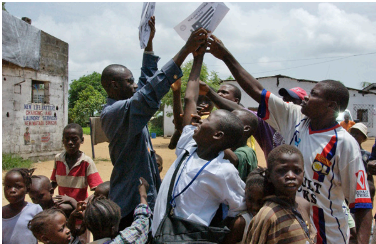
Funcionários civis da Missão das Nações Unidas na Libéria (UNMIL) contribuem para a organização das eleições no país e distribuem materiais explicativos em Monróvia (31 de março de 2005).

a maior participação destes países nos esforços pela manutenção da paz e segurança internacional. 15 Estes países possuiriam uma vantagem comparativa já que muitos passaram por situações de conflito e crises relativamente semelhantes, com programas de reconstrução e desenvolvimento que obtiveram resultados positivos e cuja experiência poderia ser compartilhada com países recém-egressos de conflito ou que estejam passando por distúrbios e/ou crises.