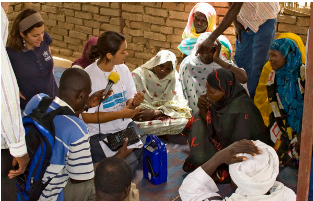
Representante da Seção de Assuntos Cívicos da Missão das Nações Unidas na República Central Africana e no Chade (MINURCAT) ensina mulheres e refugiados a utilizarem rádios carregados à luz solar (Chade, 5 de maio de 2009)