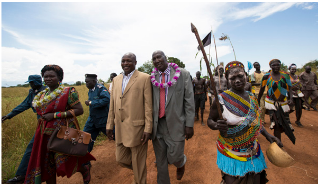
A Comissão Nacional de Desarmamento, Desmobilização e Reintegração (DDR) e a Missão das Nações Unidas no Sudão do Sul (UNMISS) transferem o programa de DDR às autoridades de Ttirangore (Sudão do Sul, 28 de outubro de 2013)