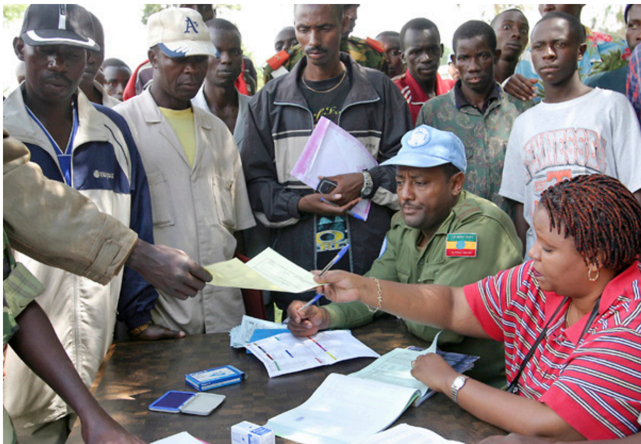
Peacekeepers e funcionários civis da ONU contribuem para o processo de desarmamento, desmobilização e reintegração de militares no Burundi (01 de dezembro de 2004)